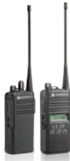
SERIE EP350 MX

También soportan accesorios de audio Mag One™, que proporcionan una opción económica para los usuarios de radio de uso ligero.