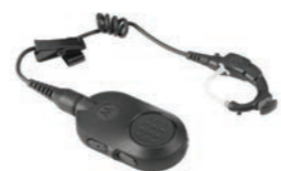
Auricular inalámbrico para operaciones esenciales

“Cuando vi por primera vez la Serie SL MOTOTRBO pensé que era un teléfono móvil, no una radio transmisora receptora. Tiene todas las capacidades de una radio transmisora receptora pero con un aspecto profesional y discreto que encaja a la perfección con todos nuestros uniformes”.