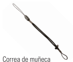
Correa de muñeca