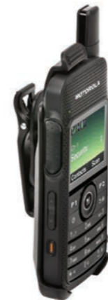
Soporte para transporte

Nuestro cargador único para múltiples unidades combina una elevada potencia con una gran imagen, permitiéndole cargar hasta seis radios o baterías al mismo tiempo. Es a la vez funcional y elegante en su diseño.