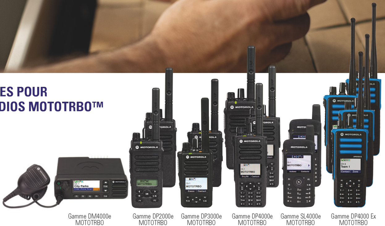
Gamme DM4000e MOTOTRBO