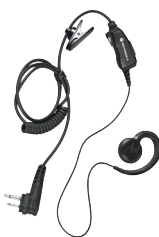
Auricular giratorio con micrófono integrado y PTT