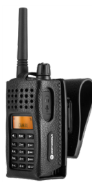
Estuche de cuero