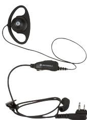
Auricular en forma de D con micrófono integrado y PTT