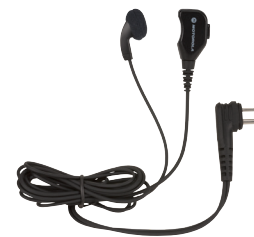
Auricular con micrófono integrado y PTT

Las radios de la serie XT600d son compatibles con los accesorios de la serie XT400, a excepción de la pinza para transporte y de la funda de cuero.