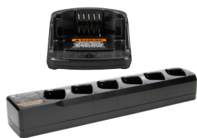
cargadores para una y varias unidad