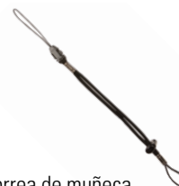
Correa de muñeca