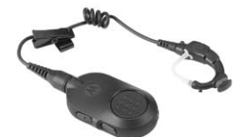
Auricular inalámbrico para operaciones esenciales

“Cuando vi por primera vez la Serie SL MOTOTRBO pensé que era un teléfono móvil, no una radio transmisora receptora. Tiene todas las capacidades de una radio transmisora receptora pero con un aspecto profesional y discreto que encaja a la perfección con todos nuestros uniformes”.